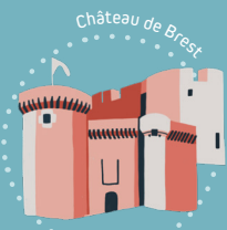
Château de Brest